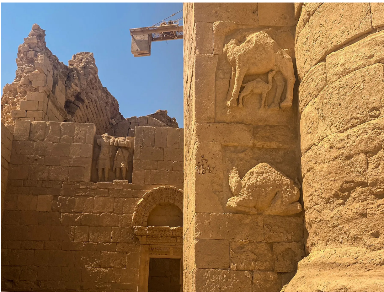
مدينة الحضر الشهادة على أقدم الممالك العربية في العراق