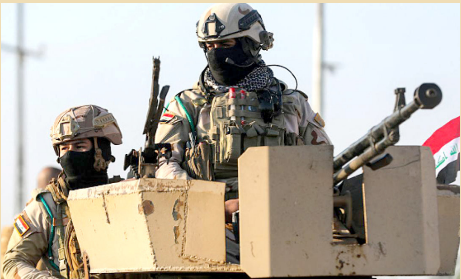
عناصر من الجيش العراقي