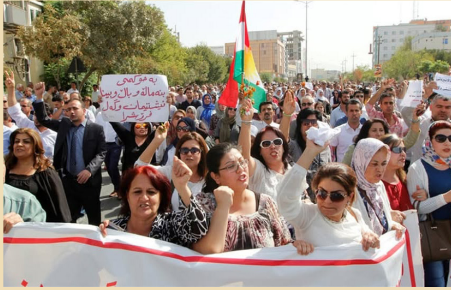
محتجون يطالبون بصرف رواتبهم (ارشيفية)

وأضاف أن «إقليم كردستان أبدى التزاماً واضحاً بقرارات المحكمة الأخادية، لا سيما قرار توظيف الرواتب، حيث قام بتسليم جميع بيانات الموظفين إلى الحكومة الأخادية». مردفاً «رغم هذا الالتزام، فإن بغداد اتخذت موقفاً غربياً جاء رواتب الإقليم».